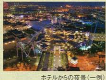
ホテルからの夜景(一例)

禁煙ルームの設定はリクエスト対応となります カジュアルルーム、コーナーファミリールームを15~24階のスタジオが見えるお部屋にグレードアップ! ※窓の一部がパークを望むお部屋となります。必ずしもスタジオ正面ではありませんので、ご了承ください。