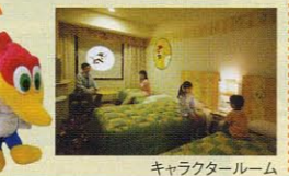
キャラクタールーム

2~3名1室・禁煙ルームのみ ウッディー・ウッドベッカー™ デザインのオリジナルぬいぐるみ(非売品、約15cm)をお一人様1個プレゼント! ※添い寝のお子様は対象外となります。 ※キャラクターはカジュアルルームからのグレードアップとなります。